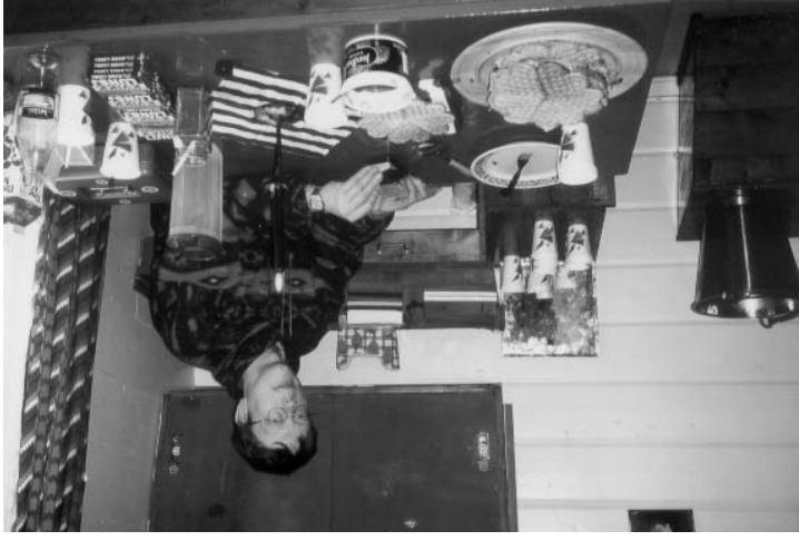
Fra en serering på Smedmyrkoia.

Friluftsklubben har som kjent patatt seg driftsansvarer for Smedmyrkoia (hyttefujobben) og vil også forsøke å holde liv i serveringsvirksomheten der oppe den kommende vinteren. Det vil bli forsøkt avholdt 10 serverings-søndager hvor ansaret for hver serveringsdag vil bli fordelt til aktuelle grupper i fortinnsvis Ungdomsgruppa og OOT/DNT-OA-systemet. I løpet av høsten vil det bli avklart hvem som skal bidra med serering og hvordan et eventuelt overskudd skal disponeres. Oppdatert informasjon mhp. datoer etc. vil etterhvert være tilgjengelig på Friluftsklubbens hjemmesider og i neste nummer av Friluft.