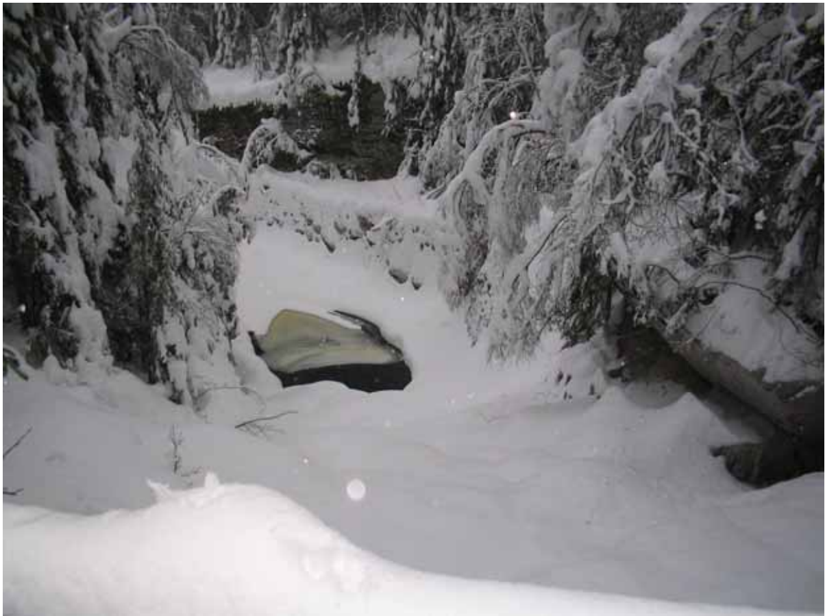
Ved Gråseterveien mellom Storebekkhytta og Slora ligger denne jettegryta.