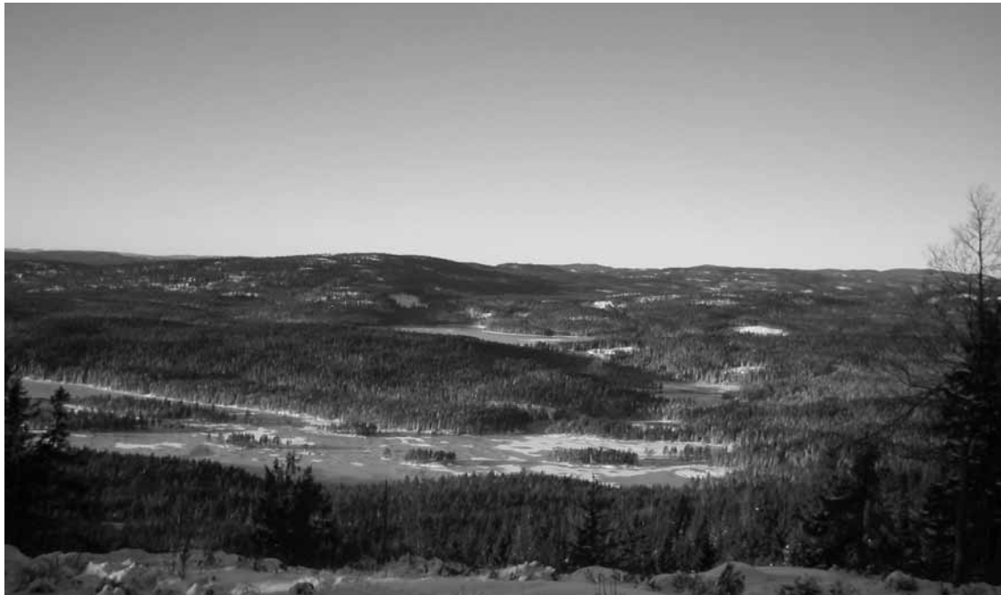
Utsikt fra Sellanrå. I forgrunnen Øyungen. Deretter Gåslungen og Rottungen Bak dette ligger Kobberhaugen.

Påmelding innen 02.02 til Magne Arentsen. Tlf. (se foran i bladet).