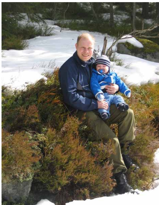
Forsidebildet: foto: Ingunn Solberg

Terje Didriksen: 22250525 (p), terje@friluftsklubben.no http://www.friluftsklubben.no