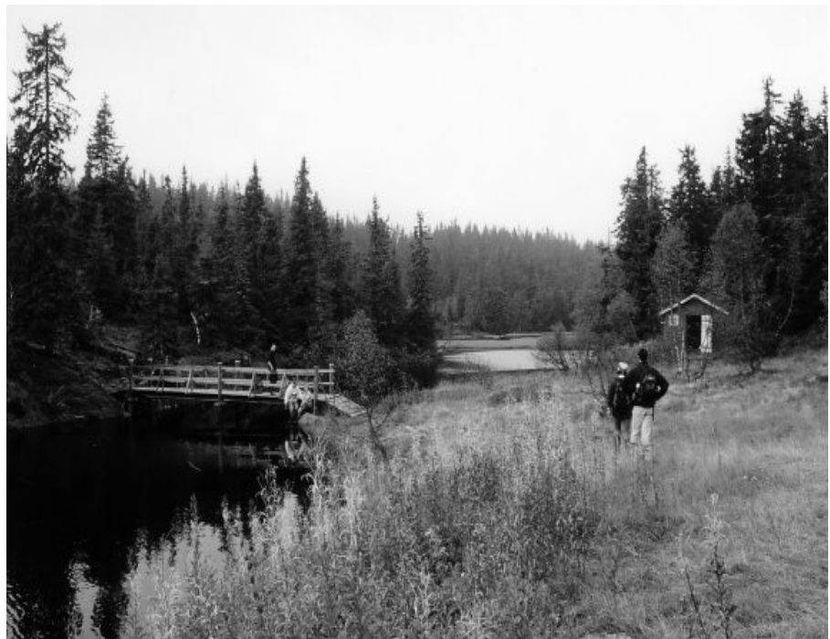
Bildet har ingen direkte tilknytning til oppgaven.

Løsningen sendes pr. Epost til magne@friluftsklubben.no . Vi trekker ut 1 vinner som får et valgfritt kart i M711-serien. Frist innen 1. juni.