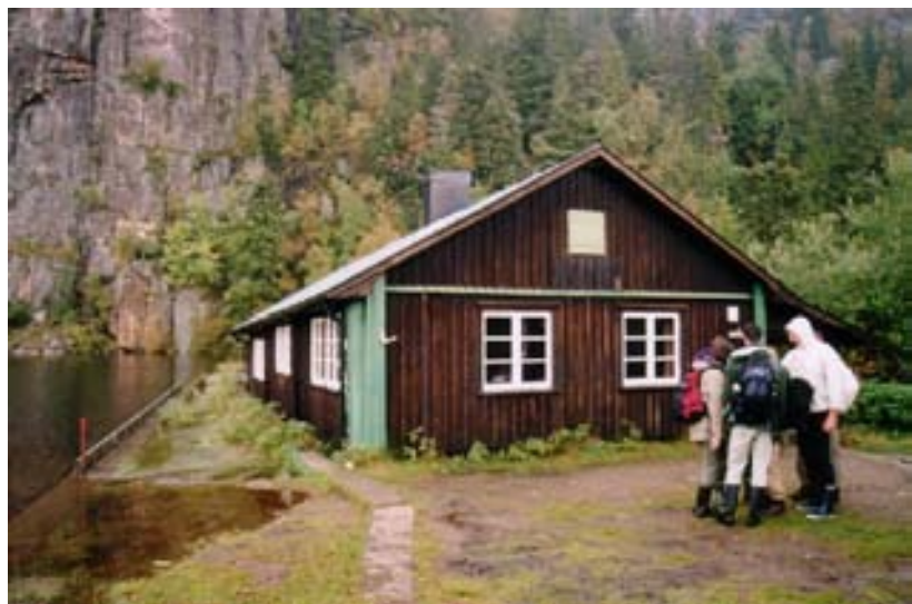
Ivarsbu (Båthuset).

Turlleder/kontaktperson: Øyvind Grandum, oyg@ffi.no, tlf. 951 47 284.