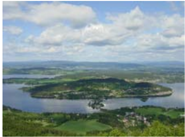
Fra Kronprinsens utsikt.

fredag 29. september – søndag 1. oktober