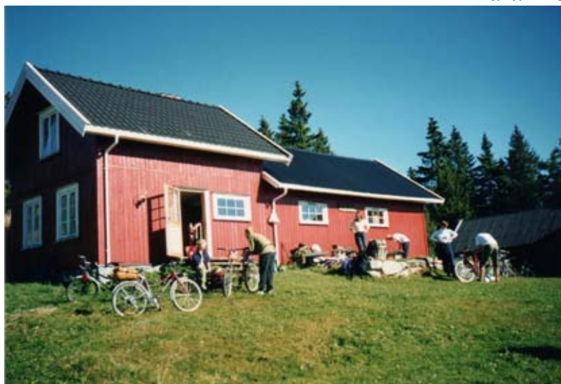
Fra en sykkelturn i marka.

Kontaktperson og turlleder er Iver Nicolai Gjersøe, tlf. 67 53 29 20 / 452 59 357