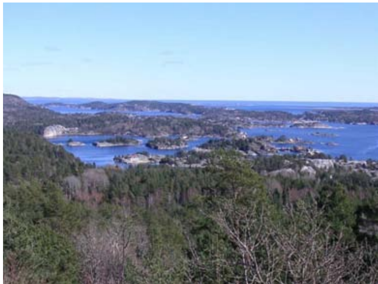
Utsikt over skjærgården.

Denne gangen holdes festen ved sjøen, nærmere bestemt på Mortens hytte i Kragerøskjærgården.