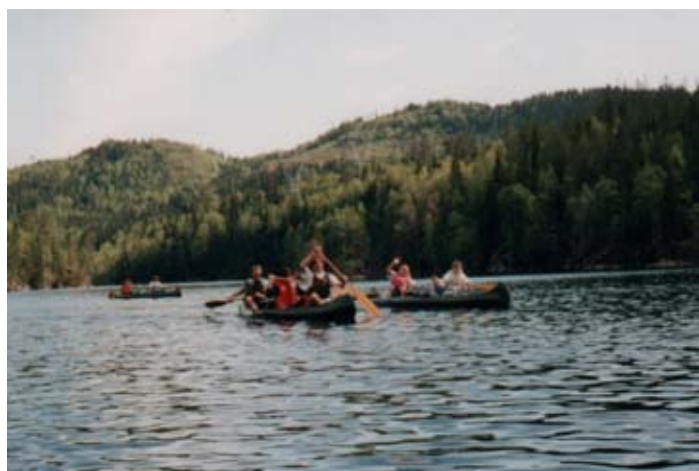
Fra en kanotur i marka.

Mat: Hver enkelt må sørge for sin egen mat og drikke. Dersom noen ønsker det kan turleder ta med engangsgriller til grillmat.