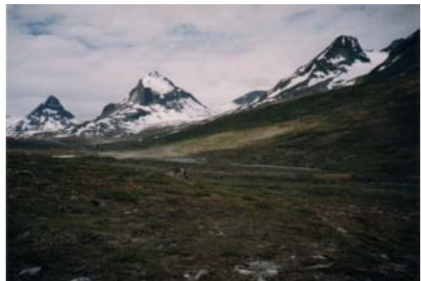
Fra Jotunheimen.