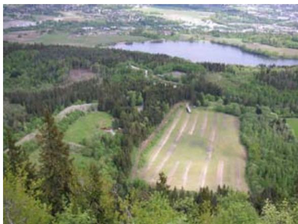
Utsikt over Jordbru.