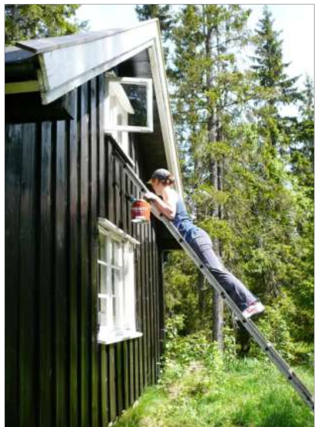
Fra dugnaden i 2012. Sydveggen får et nytt strøk beis