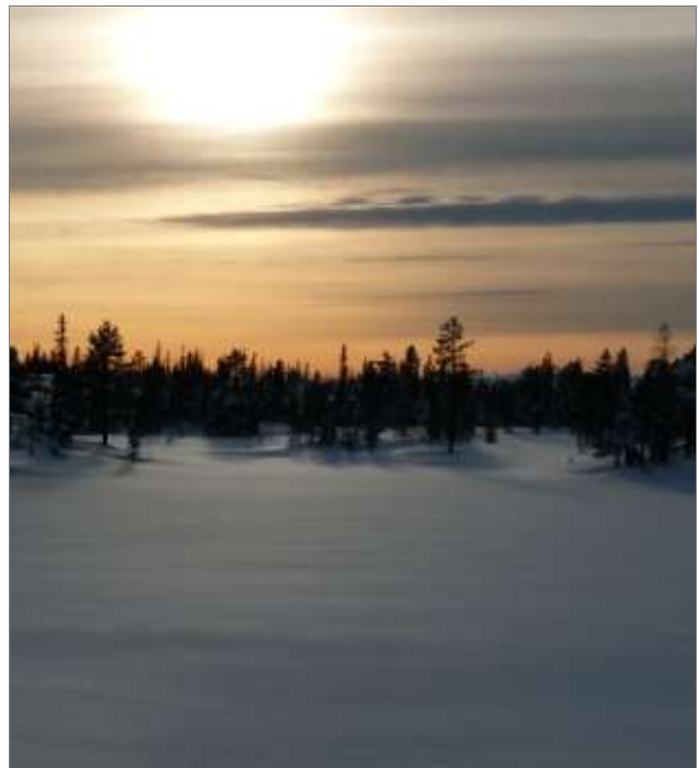
Forsidebildet, vinterkveld på Vikerfjell

Velkommen til alle nye og gamle medlemmer!