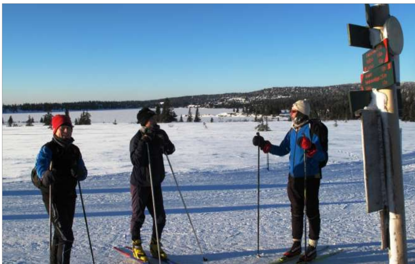
Fra en kald med deilig skitur på Sjusjøen. Skal tro om turdeltakerne står og snakker om hvordan det hadde smakt med en Smedmyrvaffel....

Har du lyst til å bidra på en servering, se forrige side.