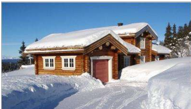
Hytta vi skal bo på

Vi har sakset følgende gjesteomtale av hytta vi har leid: "En fantastisk hytte, beliggenhet, fasiliteter og meget smakfullt innredet!! Tursti opp til fjelltoppene rett på utsiden av døren. Dette ga mersmak og jeg vil anbefale hytten til andre. Danebuområdet er helt utrolig flott" .