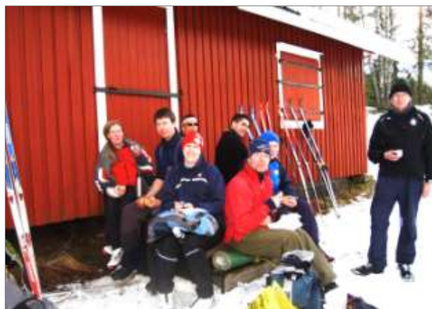
Fra en tidligere skijegertur fra Losby