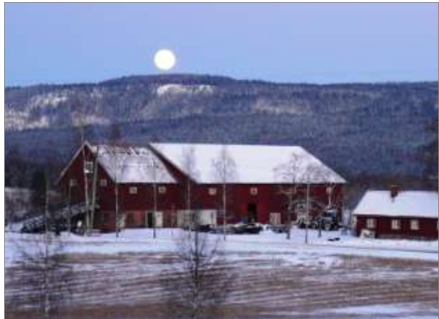
Måne i Maridalen

Ta med hodelykt til bruk i mørke partier da vi regner med å gå utenom lysløyper. Litt av vitsen er likevel å gå delvis uten lys. Det blir rast innendørs på Sandbakken, så ta med kontanter eller kort for å kjøpe drikke og mat.