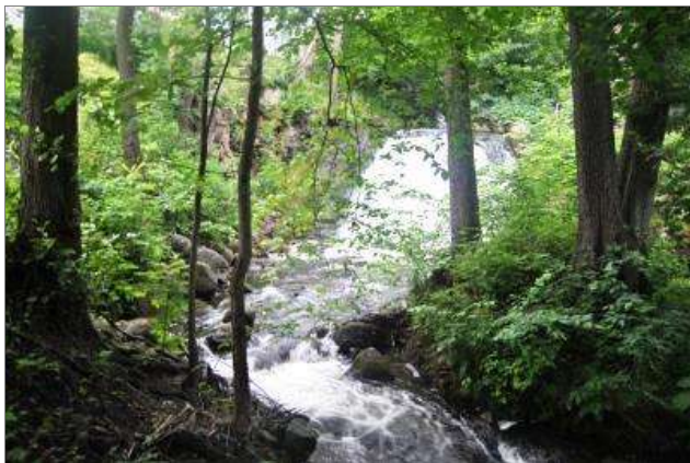
Vindernfossen

Når vi har kommet ned til Slemdalsveien går bekken igjen i en foss ved Frøen, før den forsvinner i tunnel under t-baneområdet på Majorstuen. Her går vi nord for området gjennom Thauløvs vei til Volvat før vi finner bekken igjen mellom Sørkedalsveien og Frognerparken. Her forlater vi bekken, som nå etterhvert har fått navnet Frognerelva. Herfra og videre går den ned til Frognerkilen.