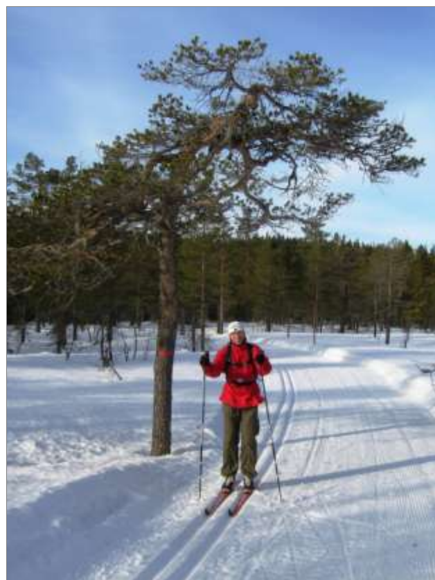
Deilig Blå Extra-føre i Grenaderløypa nedenfor Løvlia

Kontaktperson og turlleder: Magne Arentsen, tlf. 936 17 068, eller e-post, marentse@online.no